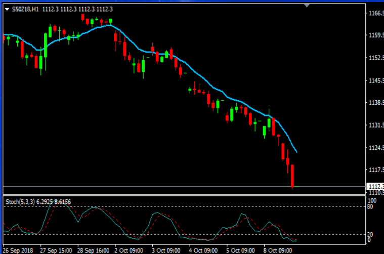
MTS MT4: S50Z18_1 HR