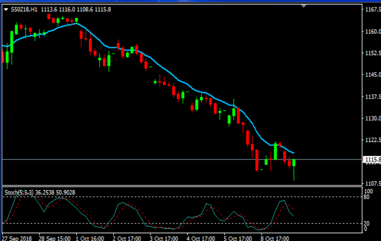
MTS MT4: S50M18_1 HR